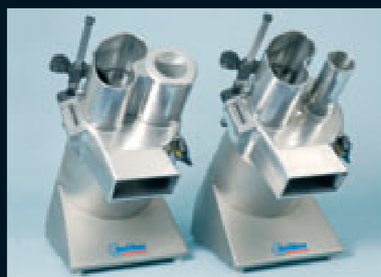
anliker Volume: la sorella maggiore dell'anliker5 per grandi cucine, mense e altri refettori collettivi.