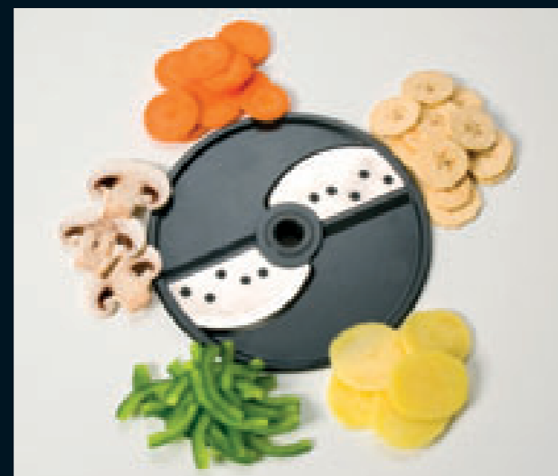
Taglio grosso (G)