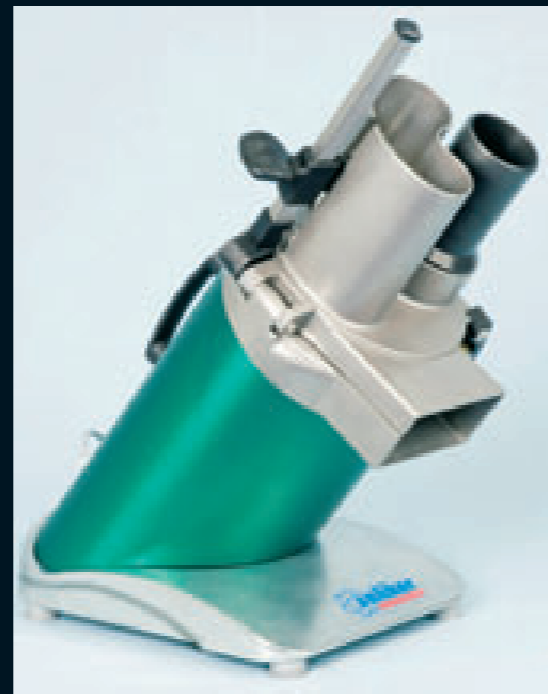
anliker Multicut 240: trasforma fino a 500 kg all'ora. Ideale per catering, aziende di produzione e altre grandi ditte di lavorazione.