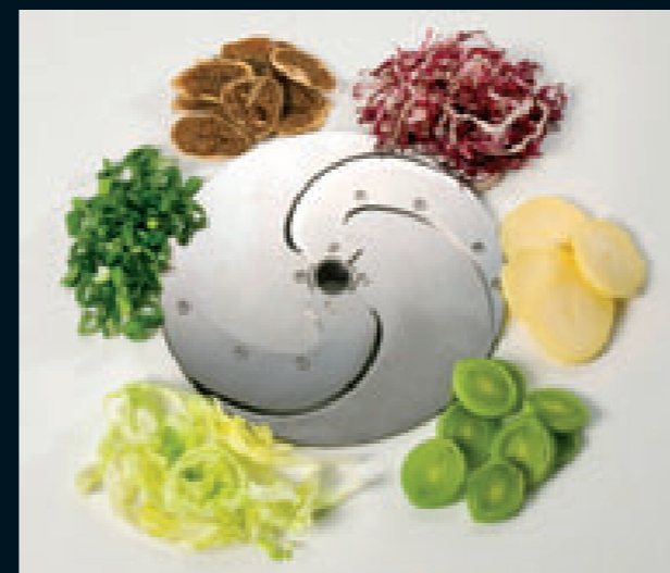
Lama a falce (SM)