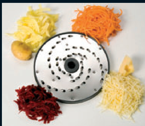
Disco grattugia (RS)