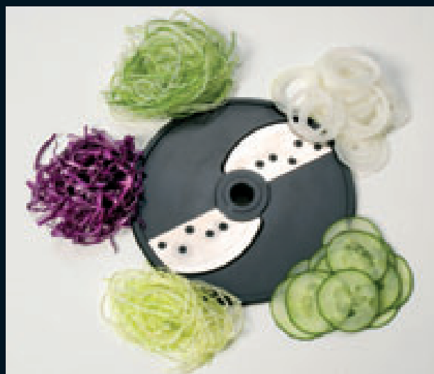
Taglio fine (F)